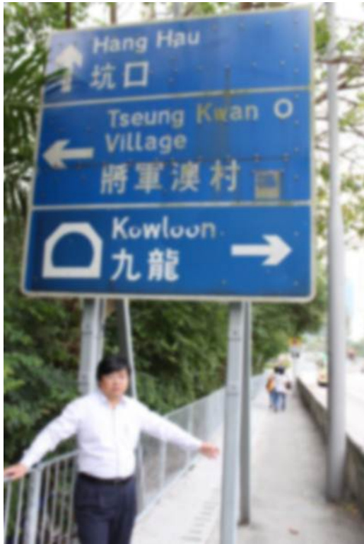
附圖一、二：寶林北路寶林至翠林段指示牌