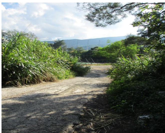
西貢北港足球場附近