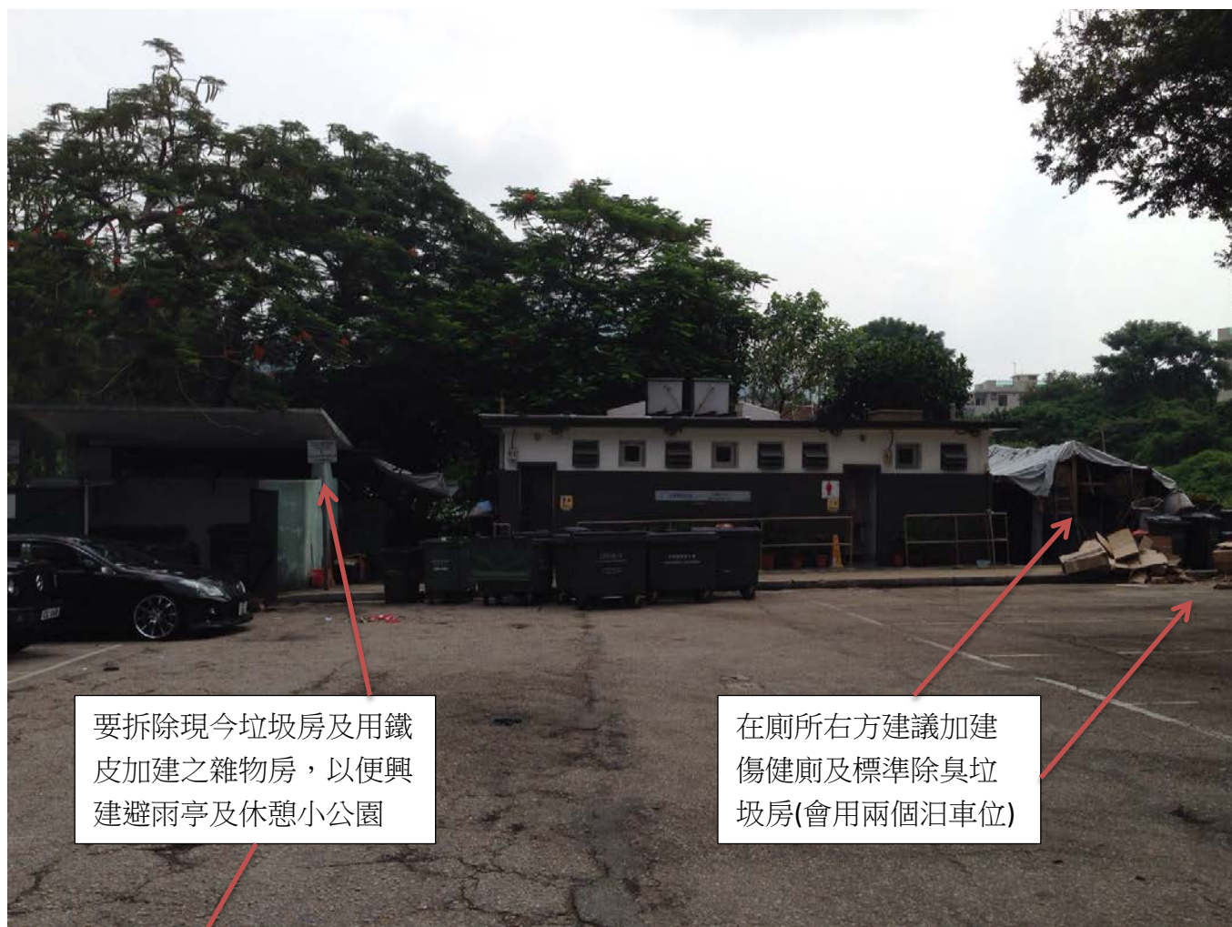
圖：建議加建傷健廁及標準除臭垃圾房_需要清拆現有垃圾房及用鐵皮屋改建避雨亭及休憩小公園