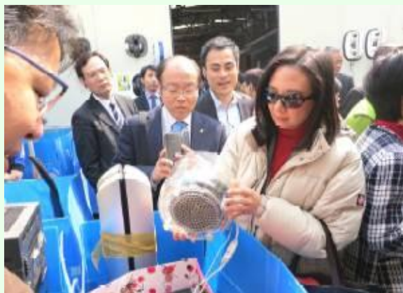
圖片摘自立法會報告