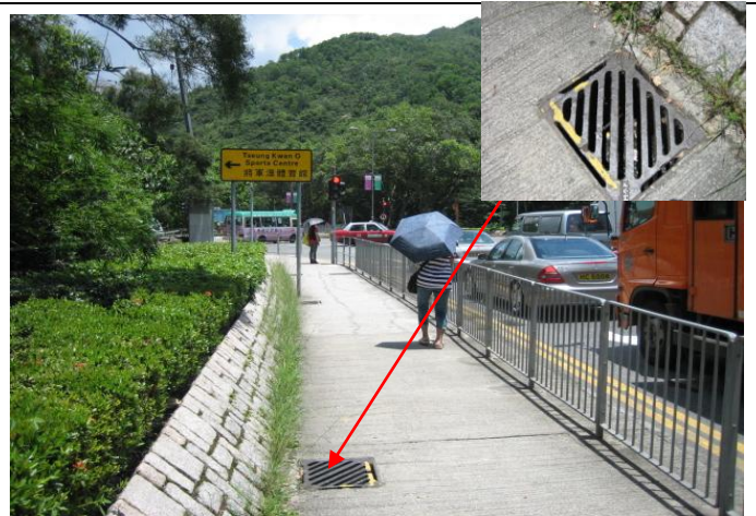
將軍澳圖書館側溝渠有積水及蚊蟲