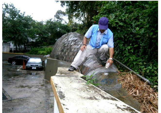
外判員工在近西貢區鄉事委員會附近山坡上的積水柱洞落蚊沙