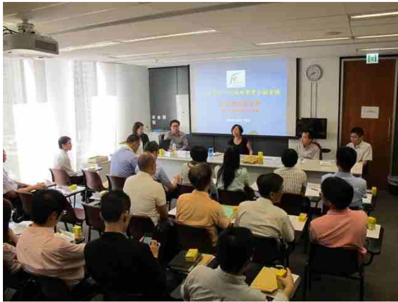
六月十九日西貢區跨部門滅蚊專責小組會議