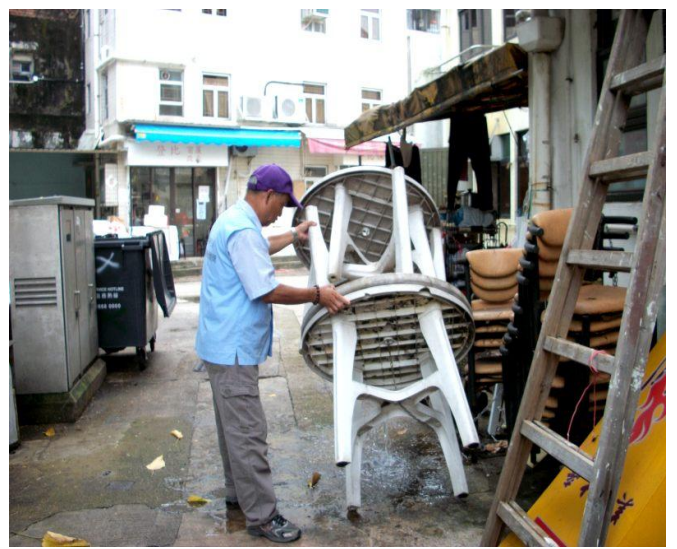
西貢一食肆後巷堆放的膠枱有積水，員工傾倒積水