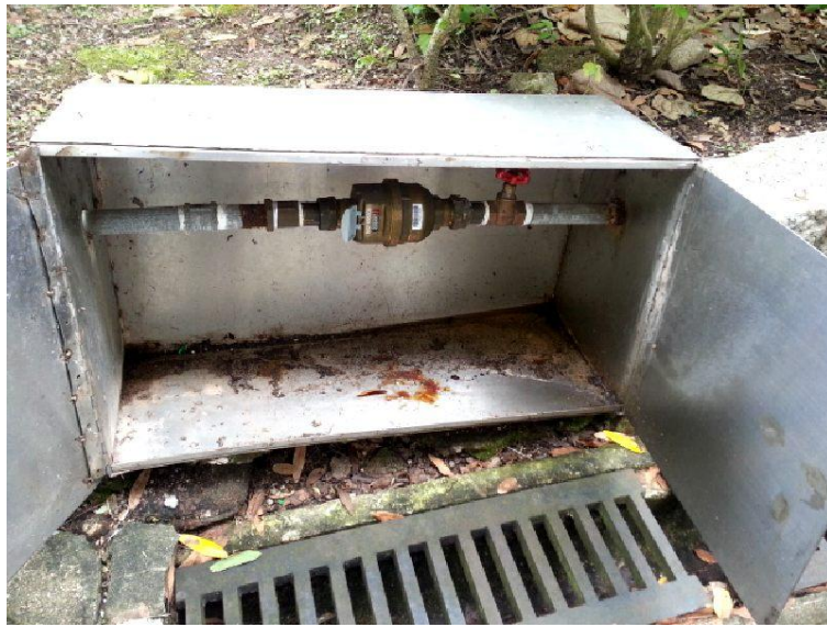
康文署在翠塘路花槽的水錶箱內有積水