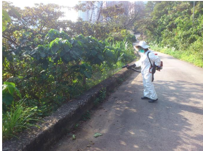
在寶林南路近靈實醫院網球場對面（燈柱編號 N2292）長滿雜草地方使用噴霧處理