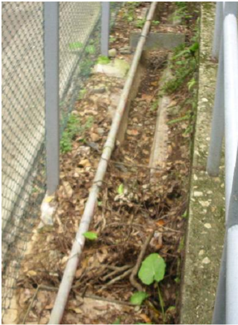
西貢崇真天主教學校中學部樓梯下的明渠被枯枝及枯葉堵塞