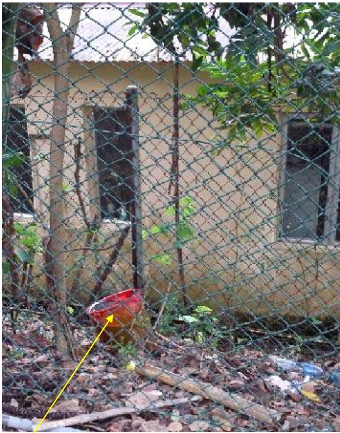
靈實醫院苗圃內石屋後面鐵線網內膠桶內有積水和蚊蟲