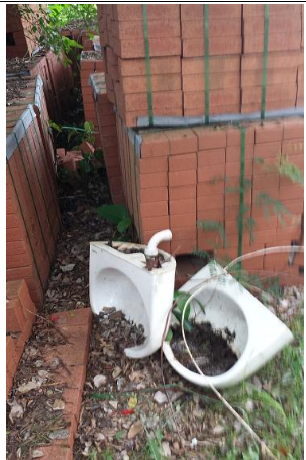
靈實醫院大樓地庫垃圾站對出山坡上2個棄置洗手盆內有積水、枯葉和蚊蟲