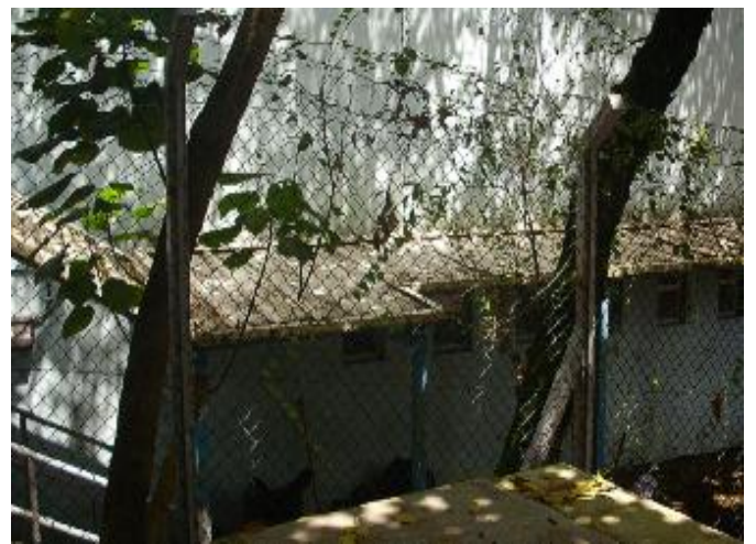
西貢崇真天主教學校 中學部樓梯簷逢頂堆積枯葉前及清理後