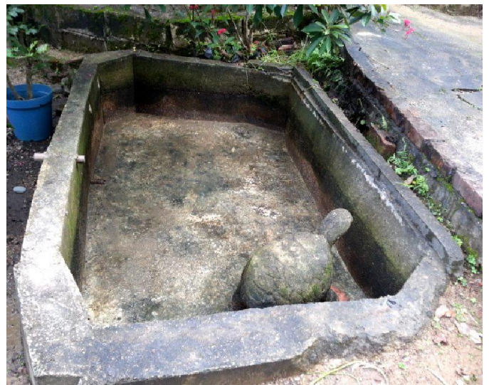
康文署對面海苗圃內的水池積水並長滿雜草，右圖是清理後