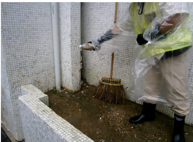
連日大雨，員工在對面海邨海泰樓五座的空置花槽積水上落蚊沙