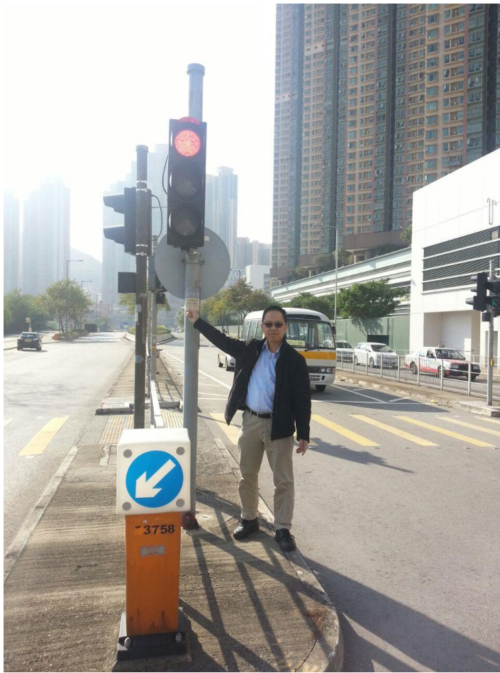
附圖一：建議在增加禁止進入指示牌