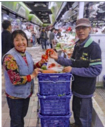
齊惜福有限公司 - 「生活添惜菜·盛食齊分享」領展街市剩食回收計劃

於領展旗下街市回收剩食，轉贈或轉化為熱食幫助貧困長者及有需要的人士，為他們帶來溫暖，並可減少資源浪費。