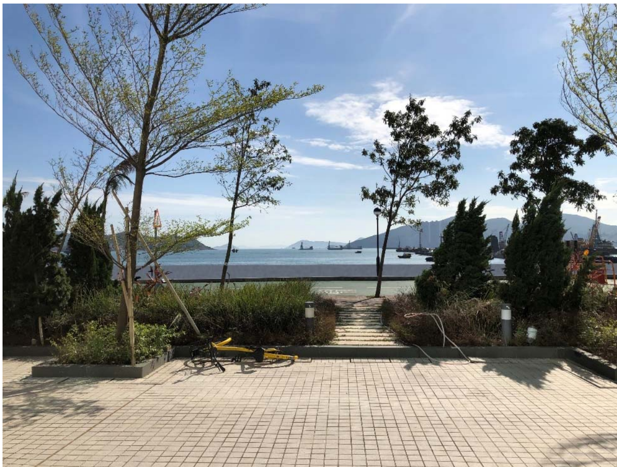
單車徑附近對出景觀