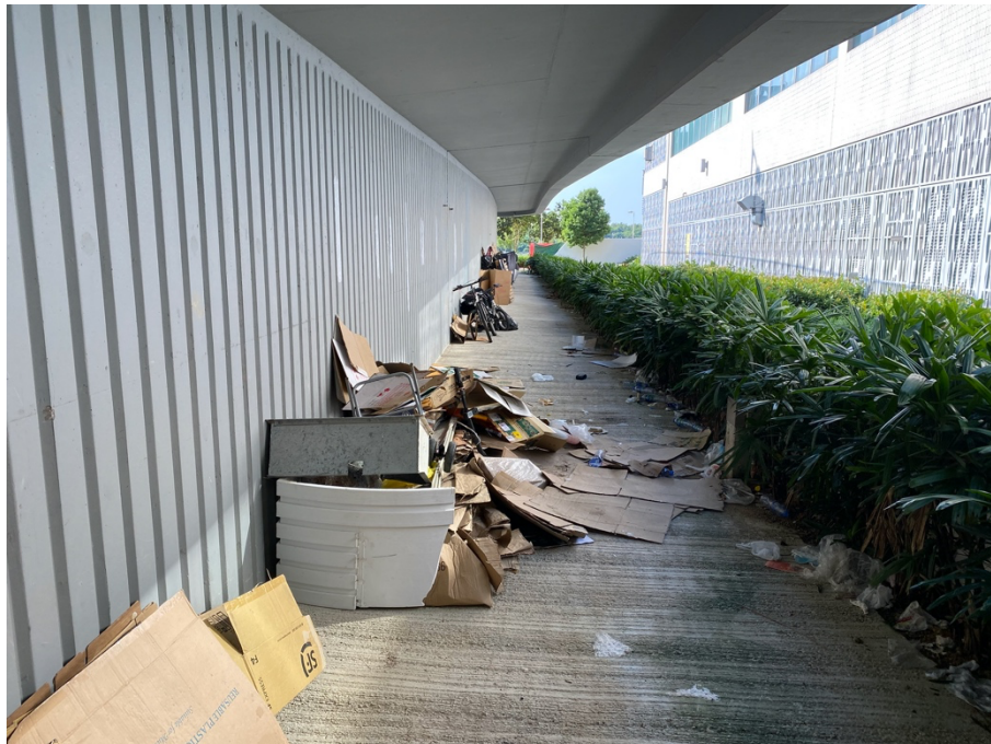
將軍澳東水道行人天橋橋底雜物擺放情況嚴重