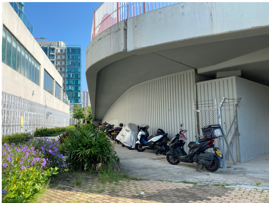
大量電單車停泊在將軍澳東水道行人天橋橋底，清晰可見政府部門沒有圍封相關位置