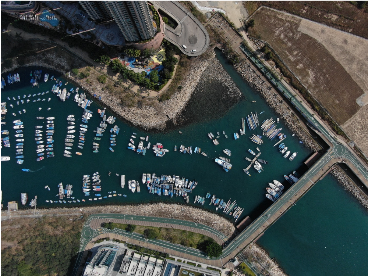
(圖三：攝於 2021 年 2 月 19 日)