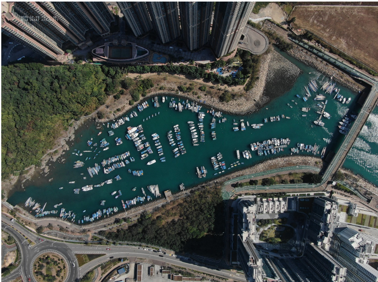
(圖四：攝於 2020 年 12 月 29 日)