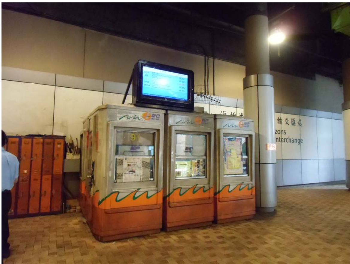
圖二：設於海怡半島巴士總站的班次資訊顯示屏