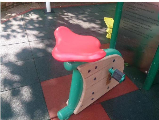
場內健身單車的設計並不適合長者使用