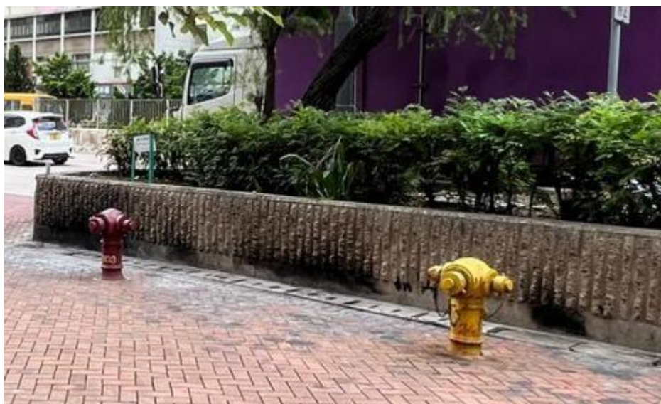
(東京街被燻黑的石牆)