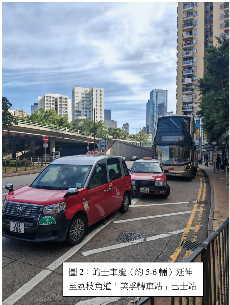
圖 2：的士車龍（約 5-6 輛）延伸至荔枝角道「美孚轉車站」巴士站