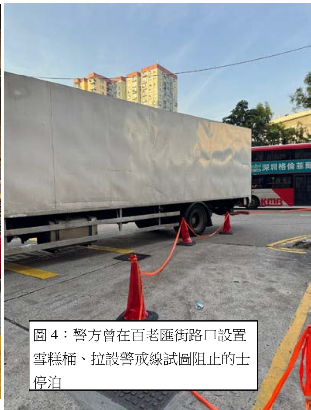
圖 4：警方曾在百老匯街路口設置雪糕桶、拉設警戒線試圖阻止的士停泊