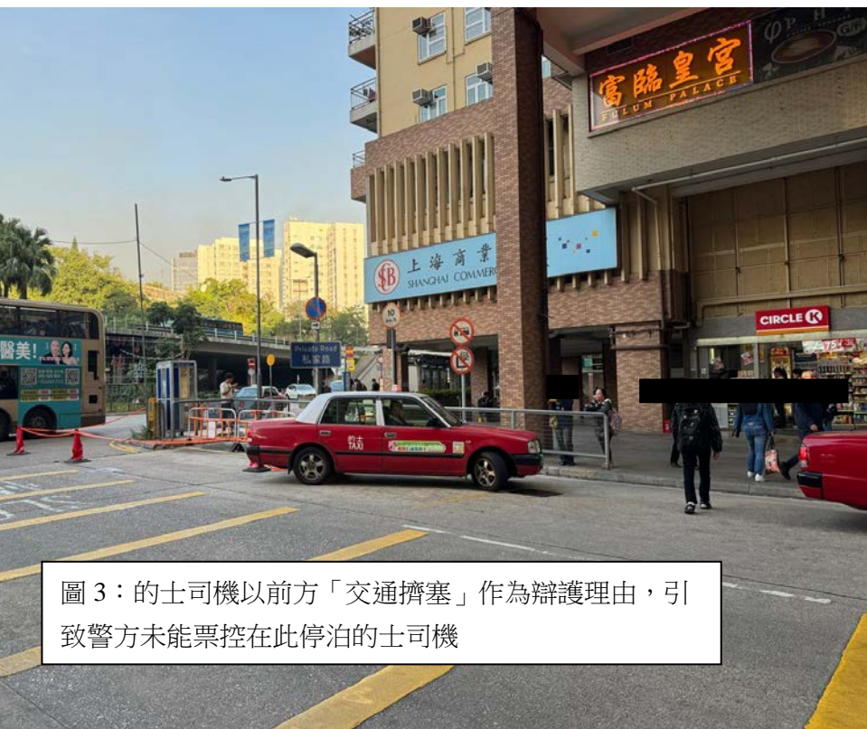
圖 3：的士司機以前方「交通擠塞」作為辯護理由，引致警方未能票控在此停泊的士司機