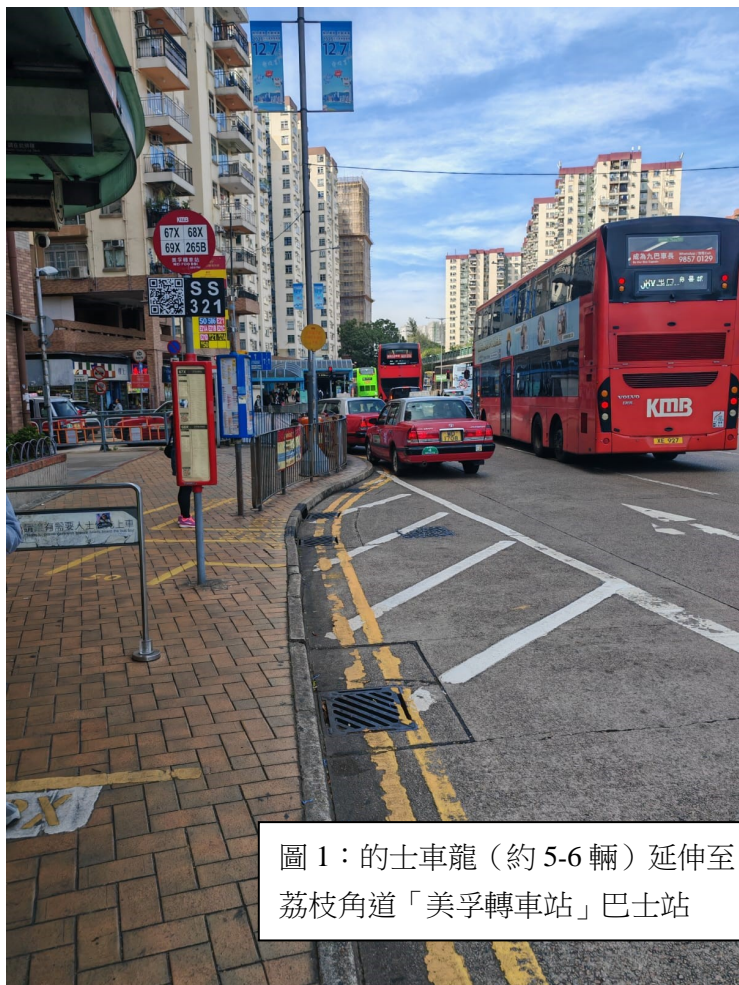
圖 1：的士車龍（約 5-6 輛）延伸至荔枝角道「美孚轉車站」巴士站