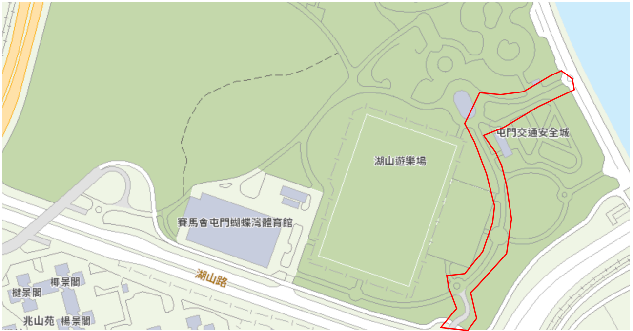
途經湖山遊樂場往返碼頭區的路線