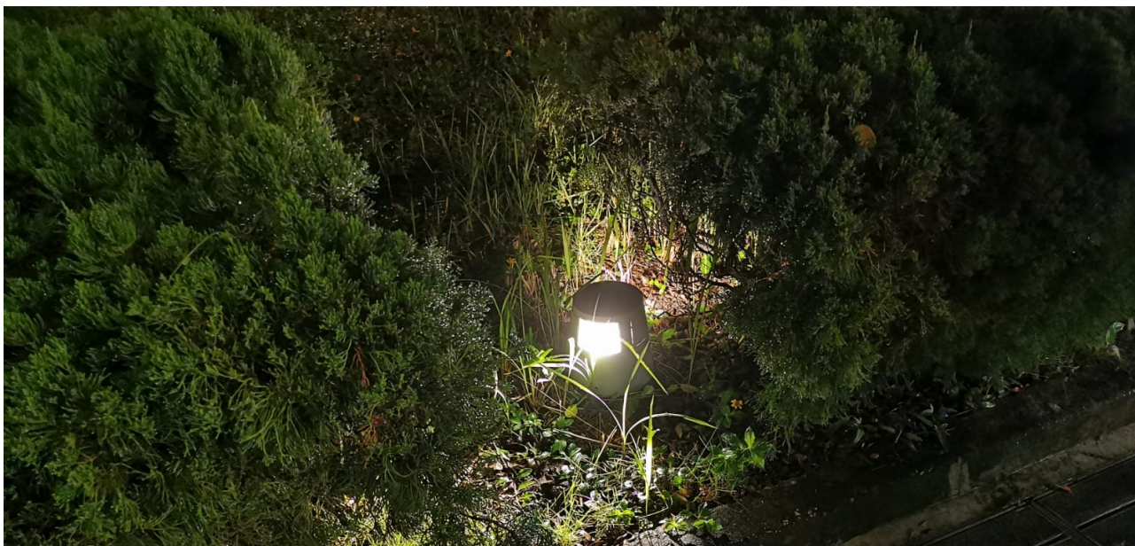
湖山遊樂場內蝴蝶灣體育館對出花槽地燈