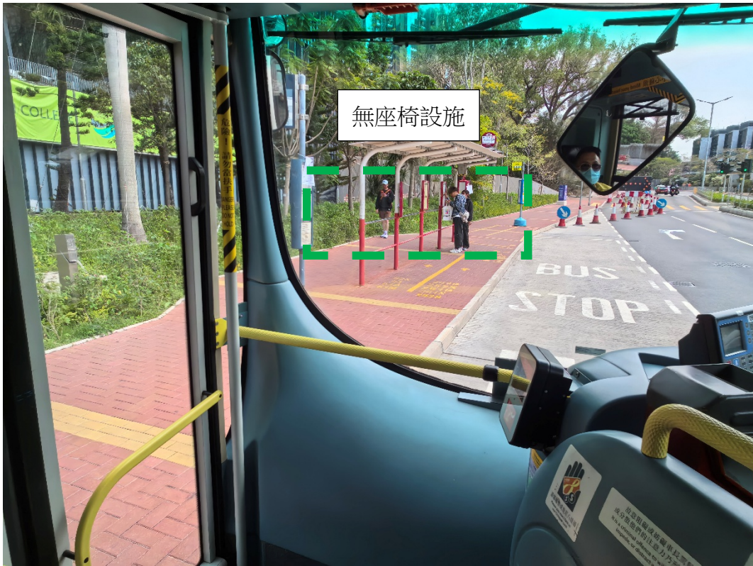
青山灣泳灘 (往九龍方向)