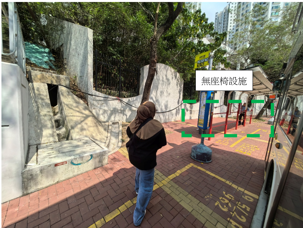
海景花園（往九龍方向）