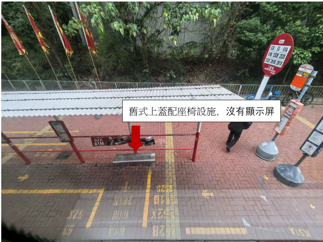
三聖邨 (往九龍方向)