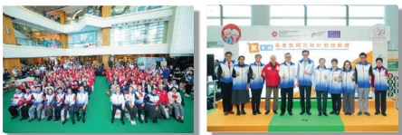
2024年12月13-14日在樂富廣場舉行的「友智識」長者數碼共融計劃的啟動禮及同樂日

為鞏固現行長者數碼共融的工作及進一步推動數碼共融，數字辦於2024年12月推出「友智識」長者數碼共融計劃（「友智識」計劃）（“Smart Silver” Digital Inclusion Programme for Elders），整合上述的恆常計劃，同時透過社會創新及創業發展基金分批撥款共一億元資助地區服務機構，為60歲或以上的長者，特別是居住在舊區及公共房屋的獨老或雙老長者，提供定時定點的數碼培訓和技術支援。我們預期計劃會惠及超過十萬名長者。