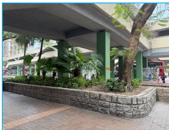
3. 大埔中心綠化地帶(近巴士站)