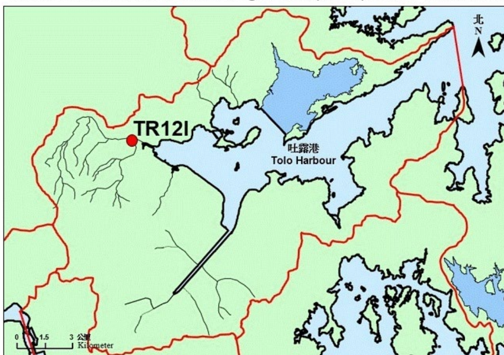
林村河河水水質監測站 (TR12I) 位置圖 Location of river water monitoring station (TR12I) in Lam Tsuen River

林村河是一條流經大埔市區，匯合大埔河後流入吐露港的主要河道。環保署在林村河設有9個常規水質監測站，每月進行一次水質監測。其中監測站 TR12I 位於林村河下游主河道。