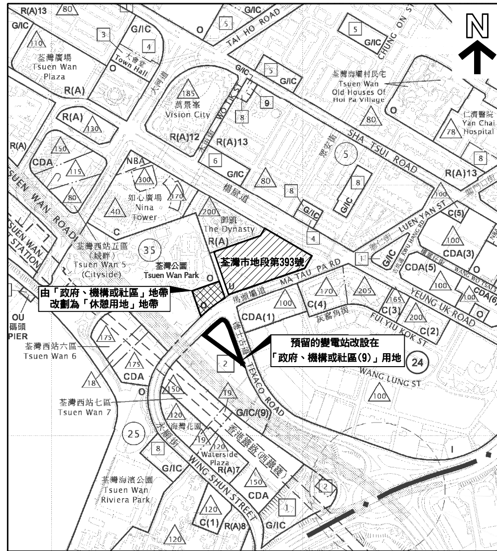
擬議土地規劃用途

本摘要圖於2013年2月26日擬備，所根據的資料為於2012年2月24日展示的分區計劃大綱圖編號S/TW/29及於2012年12月14日公布的修訂