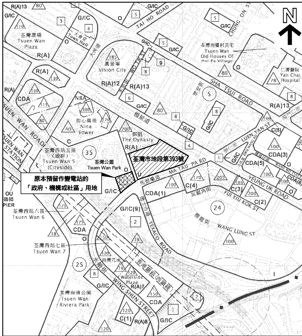
現有土地規劃用途