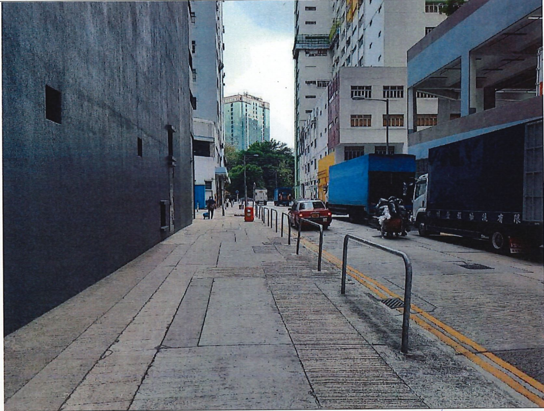
位置：龍德街（近荃灣國際中心）