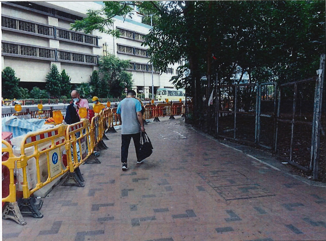
位置：古坑道與楊屋道交界