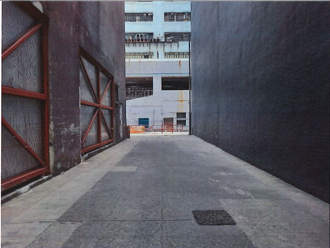
位置：荃業街（龍華國際貨運中心及荃灣國際中心之間）