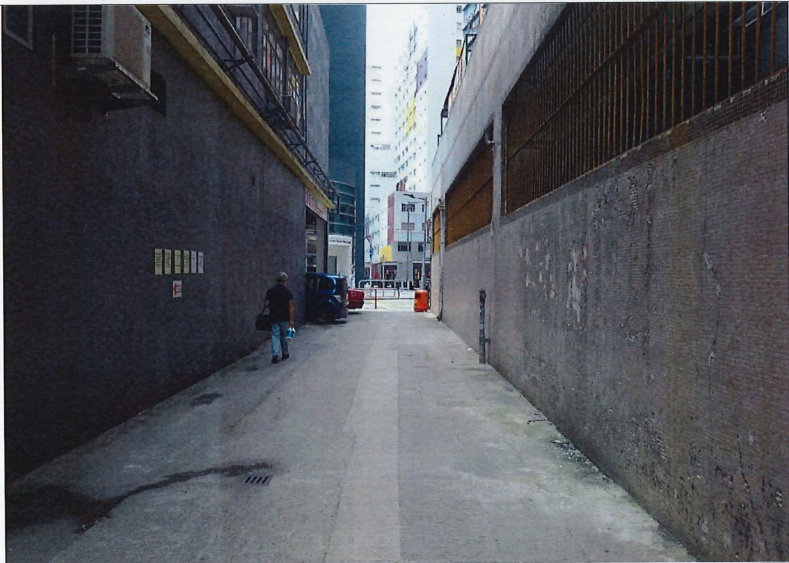
位置：橫龍街後巷近龍力工業大廈