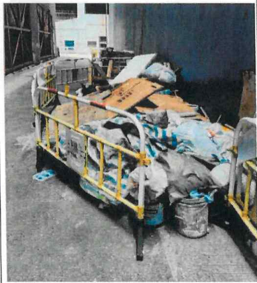
附圖 3a1 (6月17日): 小巷裏遺有兩大堆建築廢料 (第一堆)