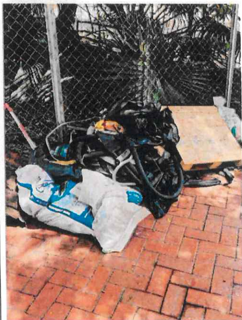
附圖 1a (6月17日)：鐵絲網旁可見一大堆建築廢料