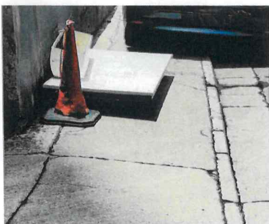
附圖 5a (6月17日)：行人路遺有少量建築廢料，但已足以堵塞整條通道