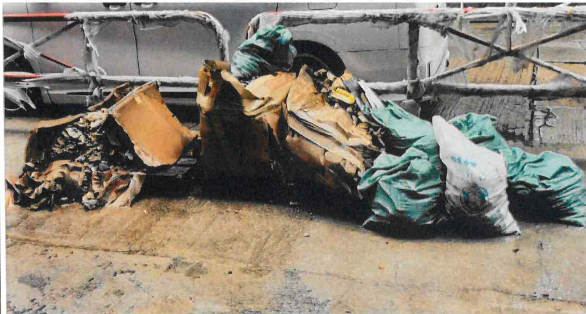
附圖 4b2 (6 月 24 日): 疑似附圖 4a 中的那箱建築廢料被推倒傾側, 瓦礫散落地上, 危及途徑行人的安全