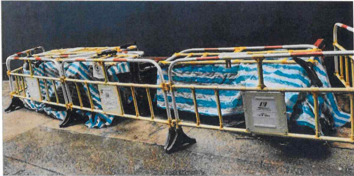
附圖 3b2 (6 月 24 日): 一星期後, 建築廢料的數目雖有所減少, 但仍遺有兩堆較細規模的廢料 (第二堆)