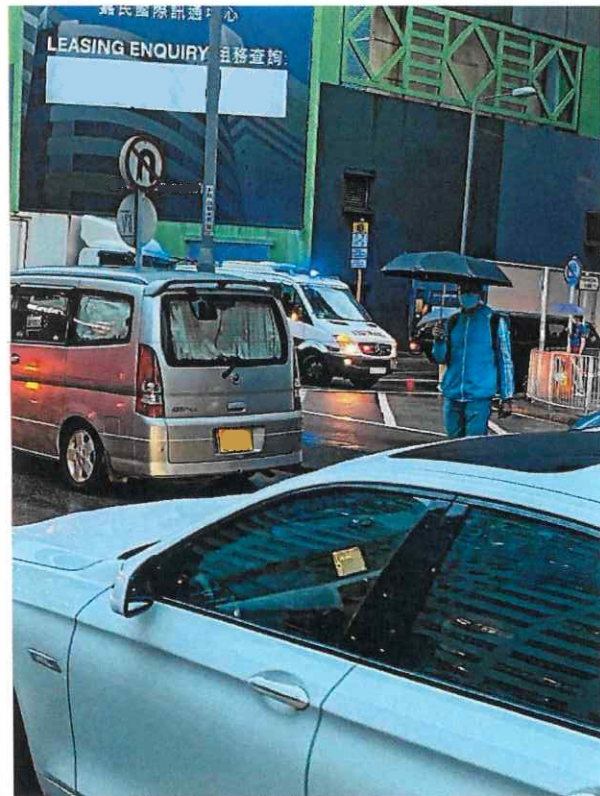
附照三：10月15日超級嚴重擠塞情況