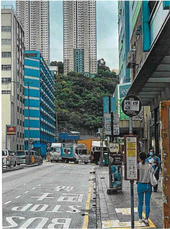
附照一：楊屋道近工業區的日間擠塞情況