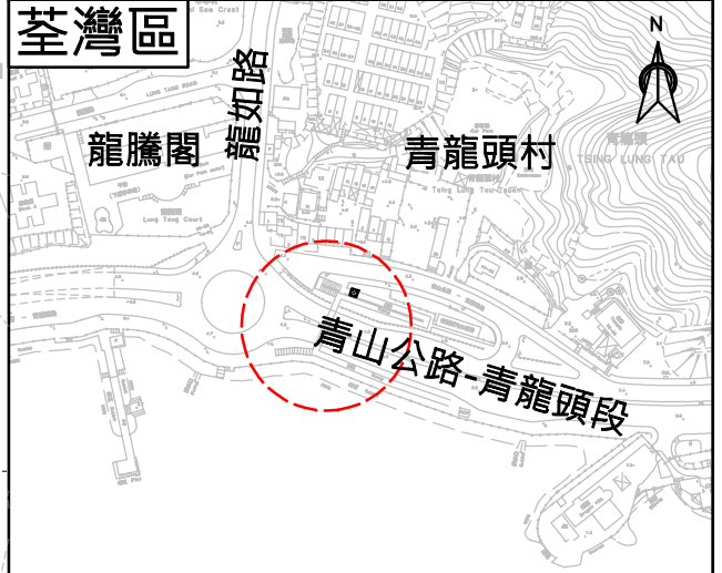
位置圖 比例 1:4000