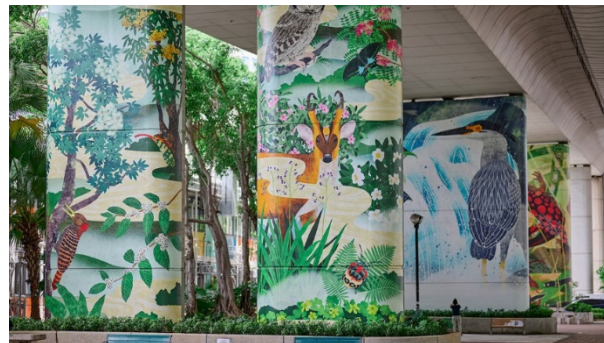
海盛花園戶外藝術裝置