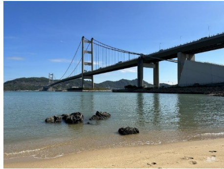
馬灣東灣泳灘往青馬大橋觀賞方向