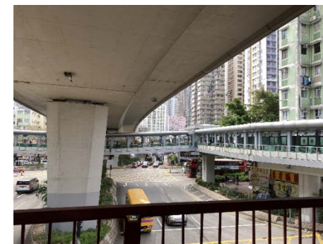
大河道行人天橋系統