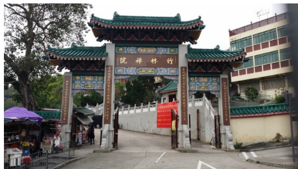
芙蓉山寺廟群（竹林禪院）