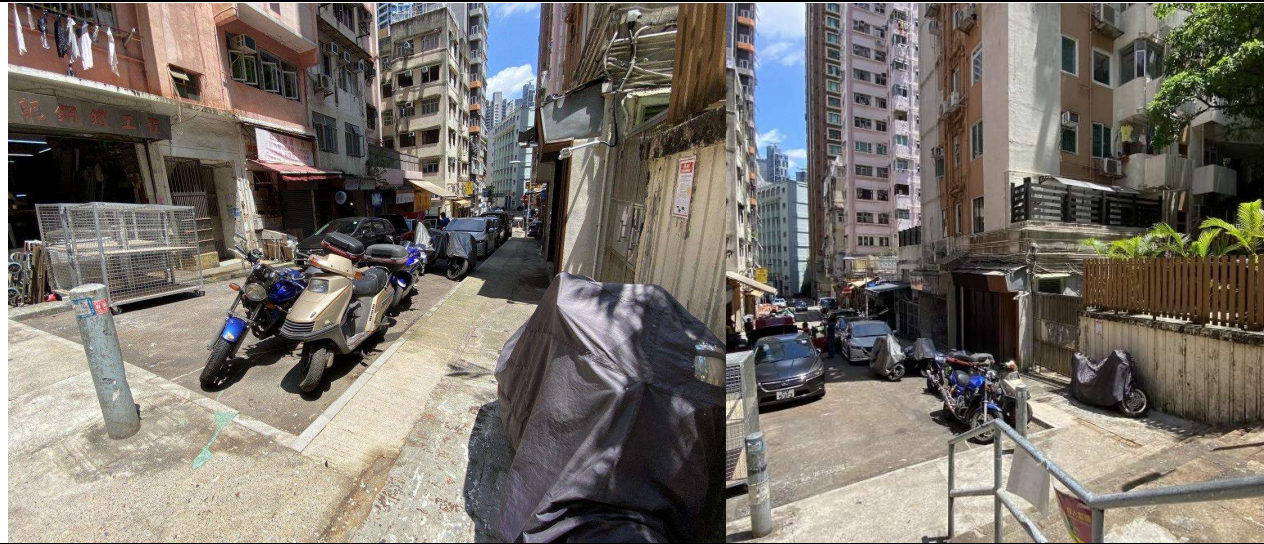
堅彌地街呂奇教育中心