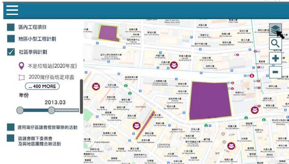
構思圖 2. 在主頁面會設有年份時間線，用家可以向左右拽拉年份時間線，觀察灣仔區指定分類項目的屆年變化（構思圖並非最終完成品的設計）