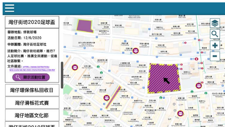
構思圖 3. 點入特定活動後所示詳情（構思圖並非最終完成品的設計，旨在以圖像表達界面的功能）