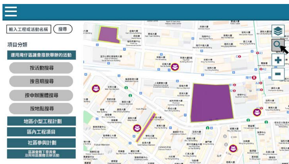
構思圖 1. 公眾可以左上方搜尋器或介面的主要分類，搜尋灣仔區過去十年項目（構思圖並非最終完成品的設計，旨在以圖像表達介面的功能）

此階段估計將會整合及梳理過去十年灣仔區議會約 8,000 項數據，並將資料轉化為可按項目、日期、申辦團體、地點（見構思圖 1.）或在地圖上拽拉年份時間線（見構思圖 2.）搜查欲查看的活動分類及其活動地點地圖。當用家點入其中一項活動，平台會顯示該活動的詳細資料，並以醒目標示在地圖上圈出活動的地點所在（見構思圖 3.）。