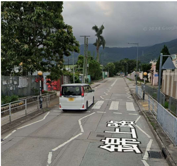
圖1:現場駕駛者大多不禮讓行人