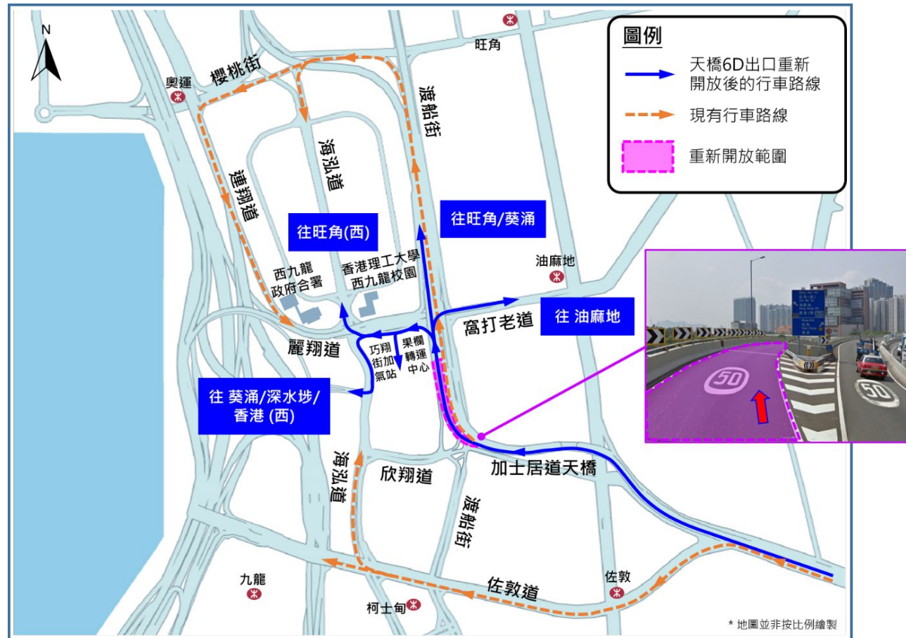
圖三：由加士居道天橋西行經6D出口往油麻地的行車路線