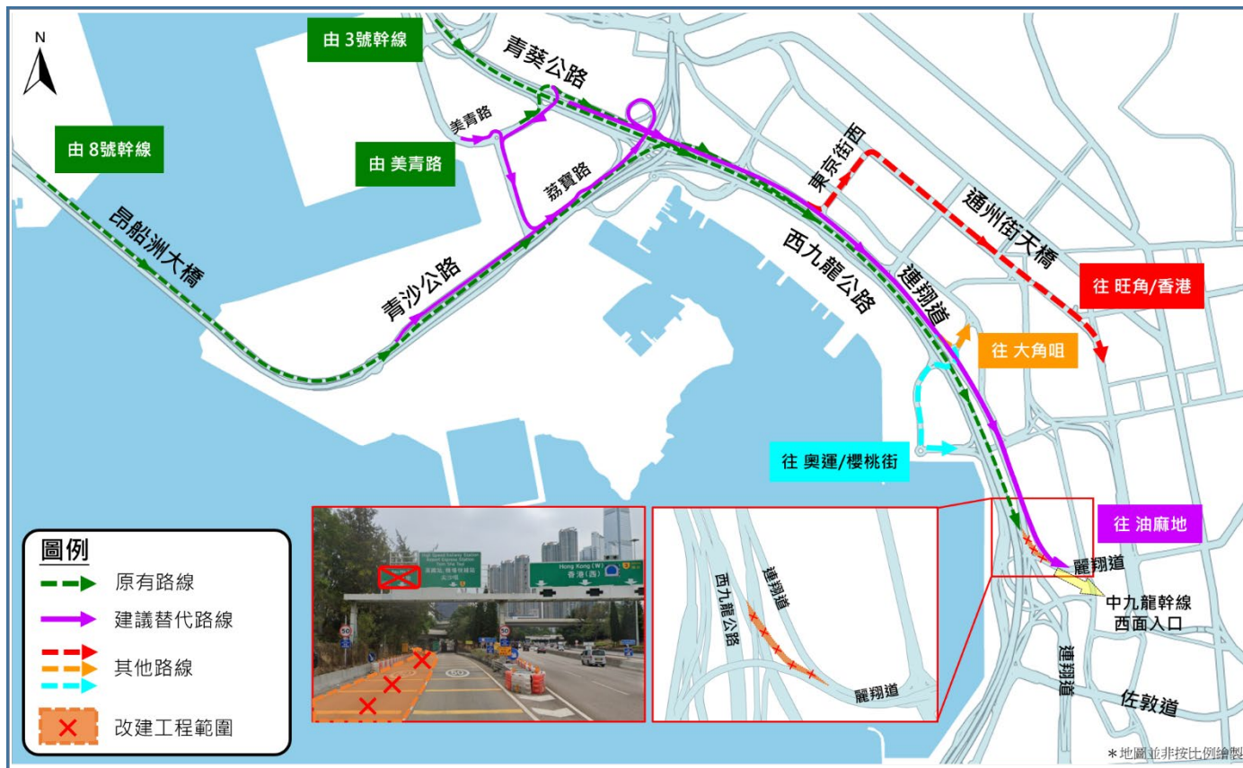
圖二：西九龍公路（南行）2號出口往油麻地支路的改建工程開始後的建議行車路線