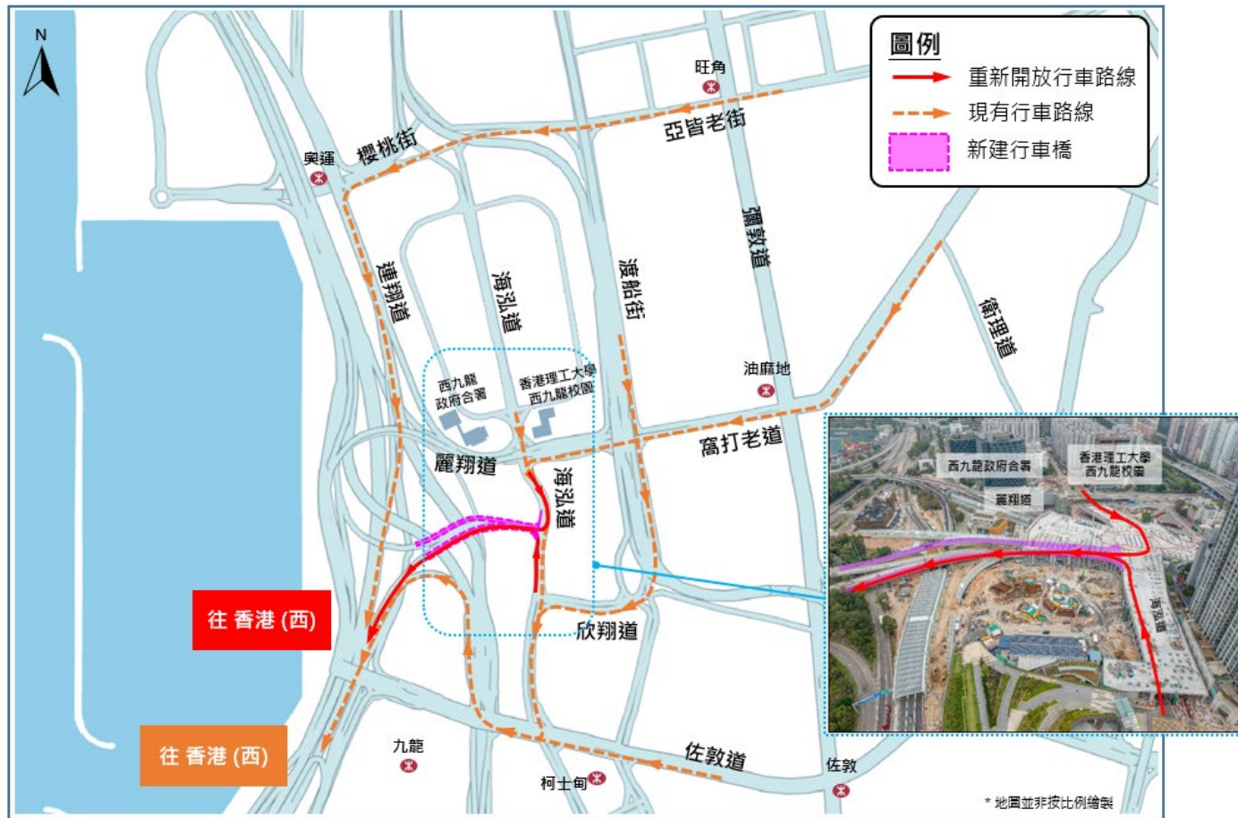
圖一甲：從海泓道經新建的行車橋南行前往香港（西）的行車路線