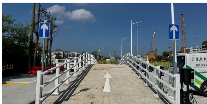
私家車及輕型貨車訓練斜坡