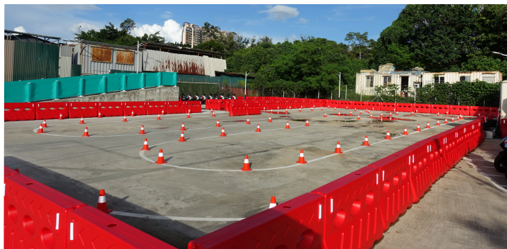
電單車強制試場地