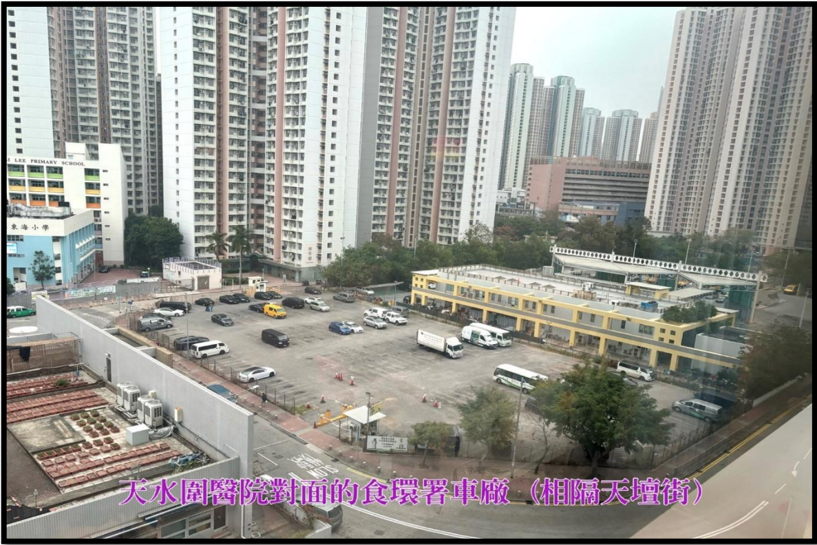
天水圍醫院對面的食環署車廠 (相隔天壇街)