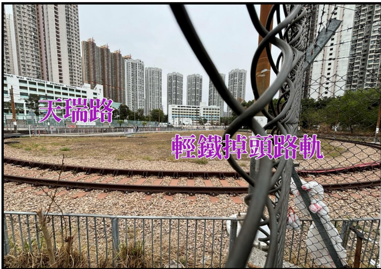
臨時停車場土地撥作擴建醫院用途