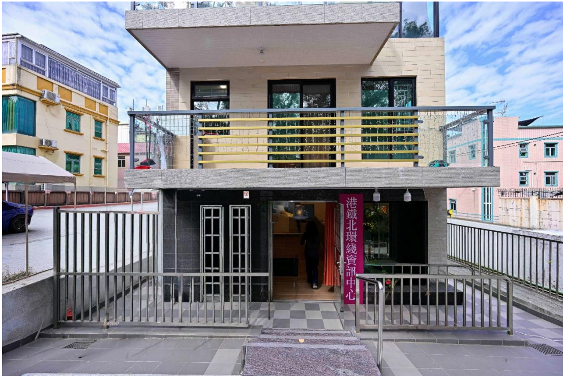
港鐵北環線資訊中心