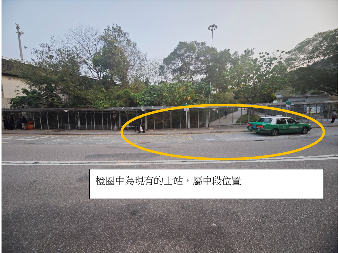
橙圈中為現有的士站，屬中段位置