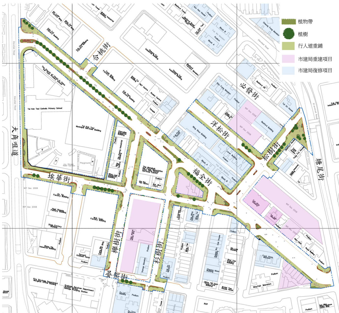
大角咀活化計劃 - 第三期項目範圍