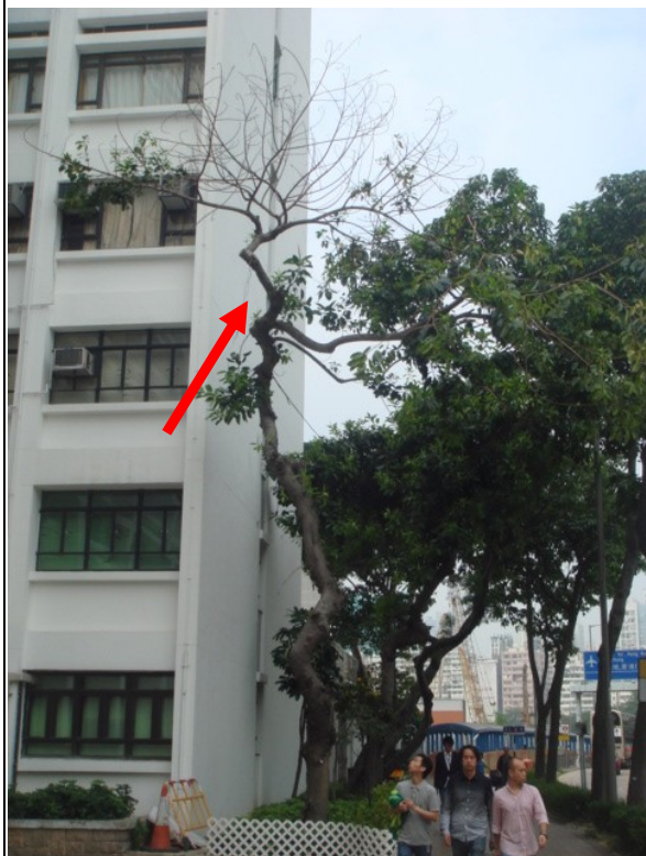
6. 廣東道路邊花床 – 印度橡樹