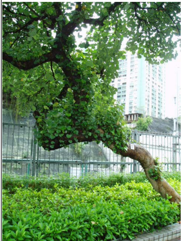
5. 衛理道臨時休憩處 – 黃槿