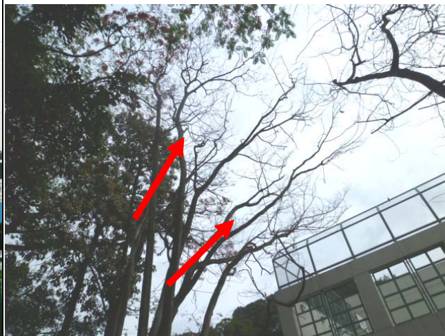
3. 衛理道臨時休憩處 – 台灣相思