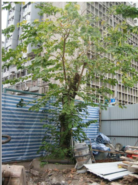
8. 界限街遊樂場 - 宮粉羊蹄甲