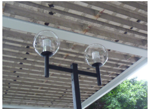
將現有 6 個公園燈泡更換為 35 瓦燈泡