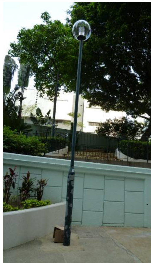
23 個公園燈泡更換為 35 瓦燈泡