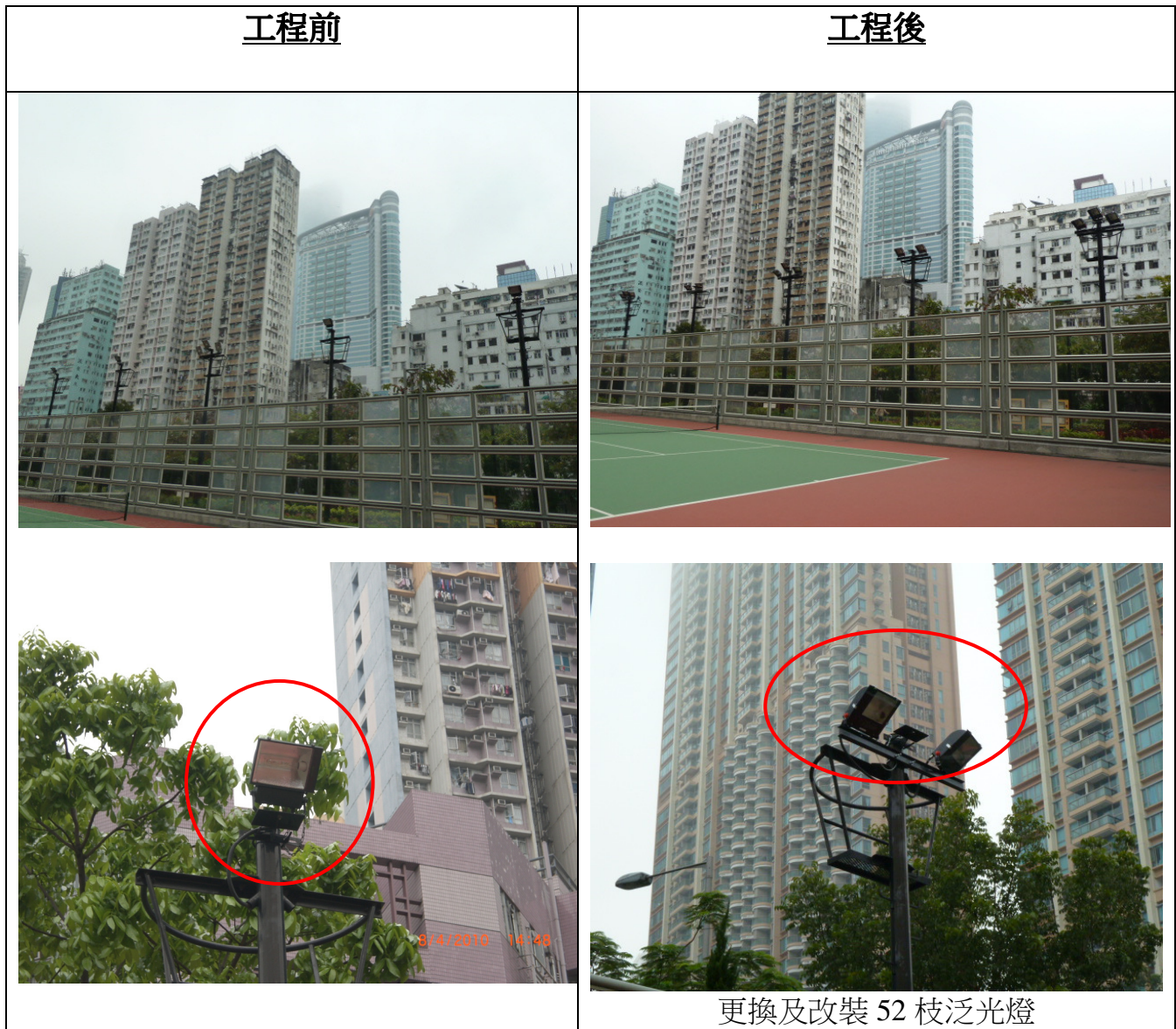
更換及改裝 52 枝泛光燈