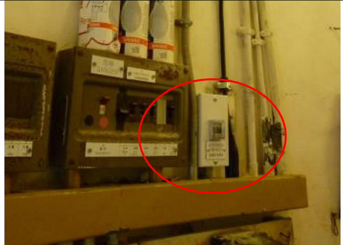
加裝 1 組日出日落智能(經緯度)時間掣