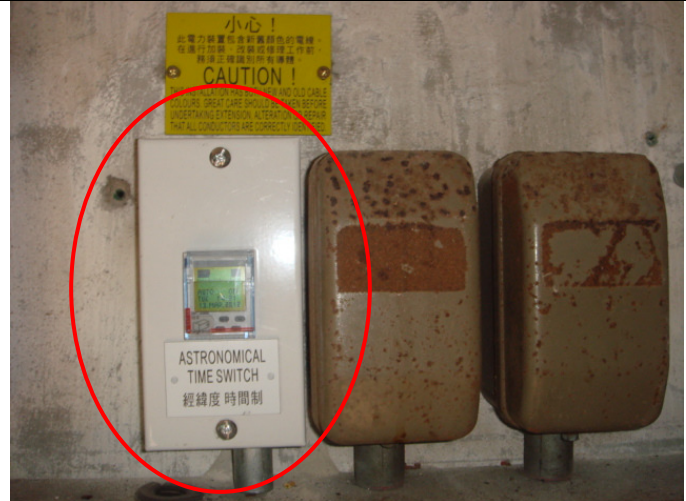
加裝 1 組日出日落智能(經緯度)時間掣