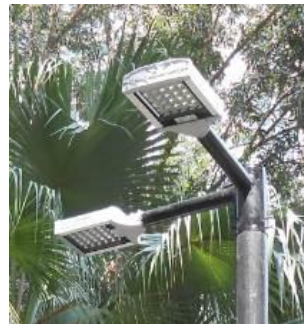
建議更換公園燈燈泡為發光二極管節能燈泡及於燈柱頂部安裝反射板