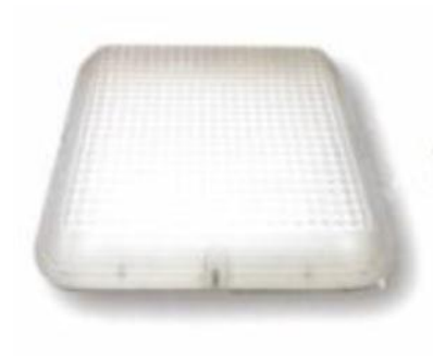
建議更換隧道壁燈的燈具款式