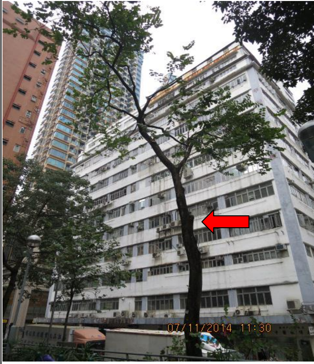
7. 埃華街休憩花園 - 宮粉羊蹄甲