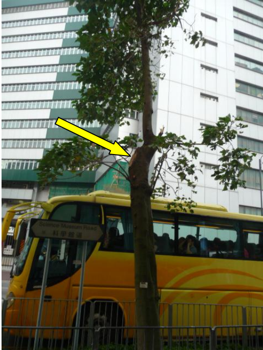
3. 科學館道路邊花床 - 石栗