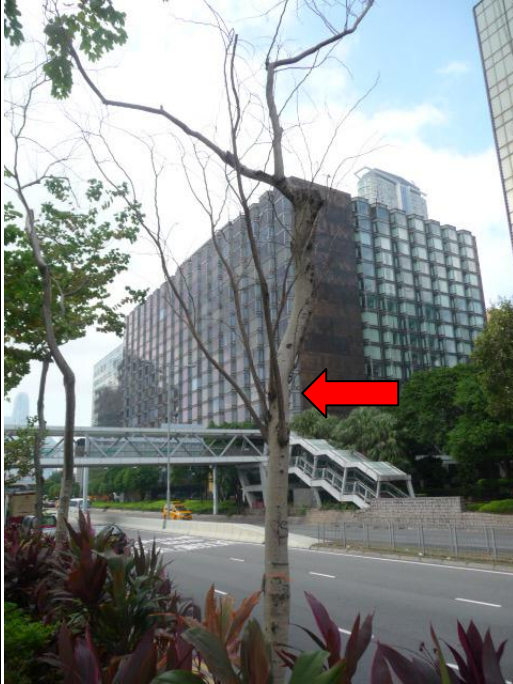
5. 尖沙咀海濱花園 - 宮粉洋蹄甲