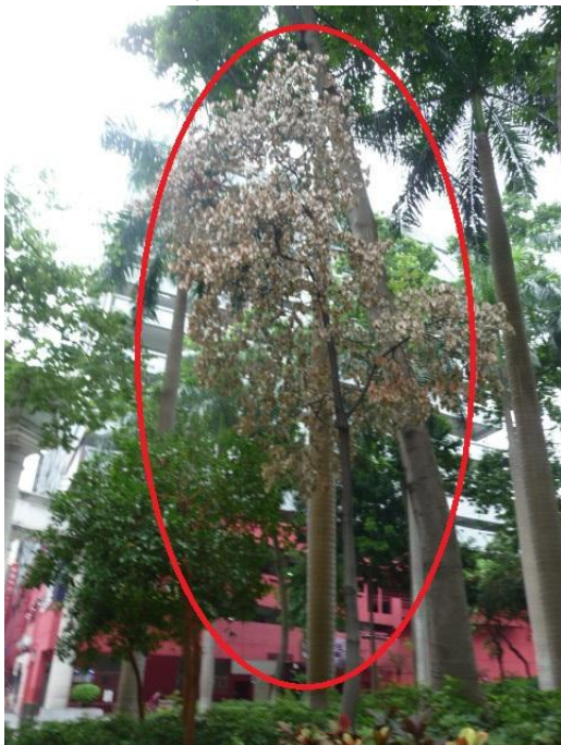
2. 市政局百週年紀念花園 - 梭羅樹