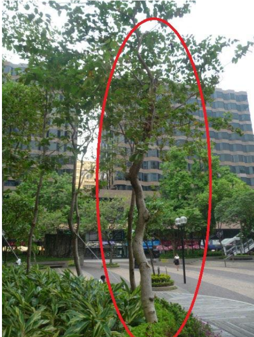
1. 市政局百週年紀念花園 - 洋紫荊