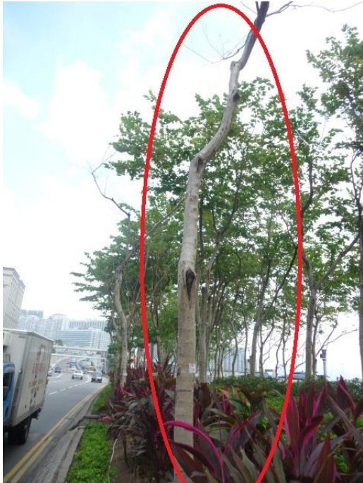
4. 尖沙咀海濱花園 - 宮粉洋蹄甲