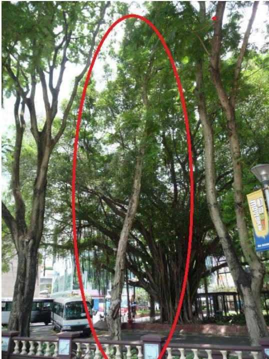
6. 加連威老道路邊花床 - 盾柱木