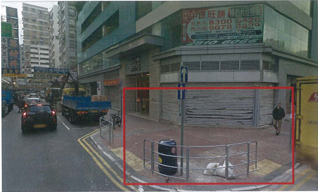
附圖 1：圖中紅框所示位置寬敞，該處經常出現非法棄置大型傢私及雜物