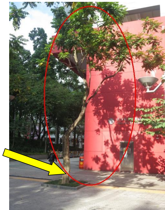
5. 市政局百週年紀念花園 (火焰木)