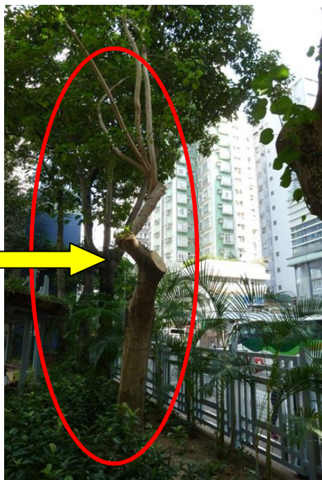
1. 西貢街遊樂場 (黃槿)