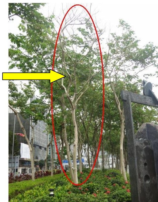
6. 尖沙咀海濱花園 (宮粉洋蹄甲)