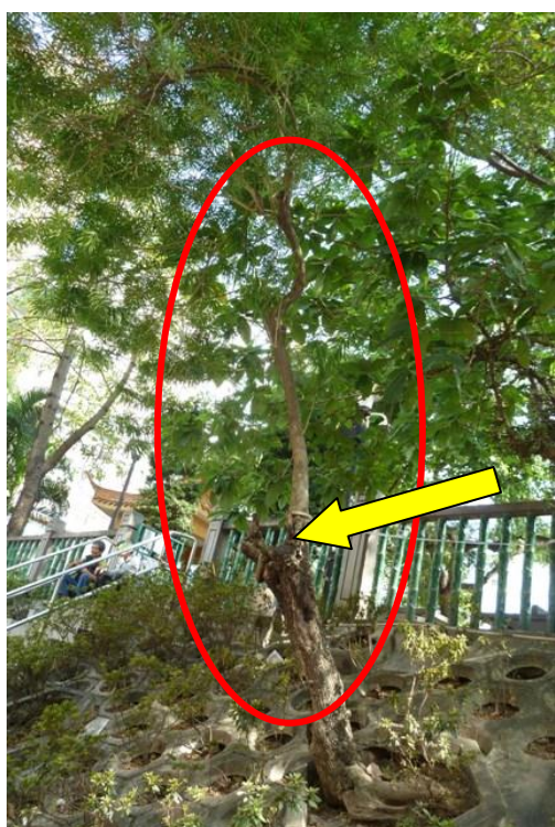
2. 眾坊街休憩花園 (黃花夾竹桃)