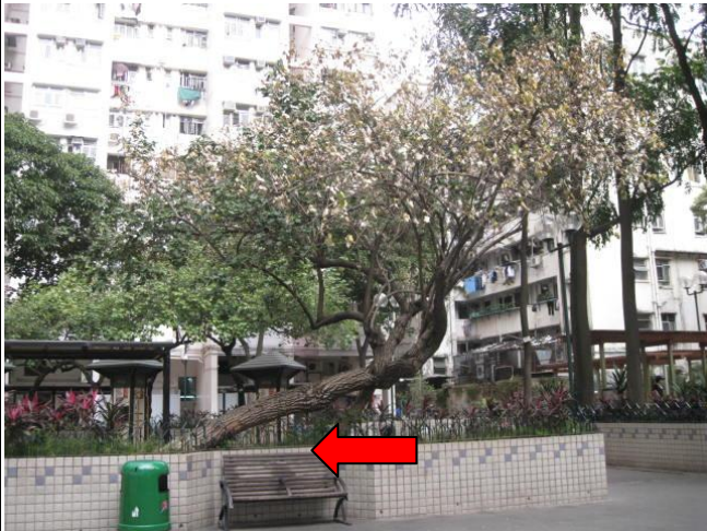
5. 地士道街休憩花園 (黃槿)