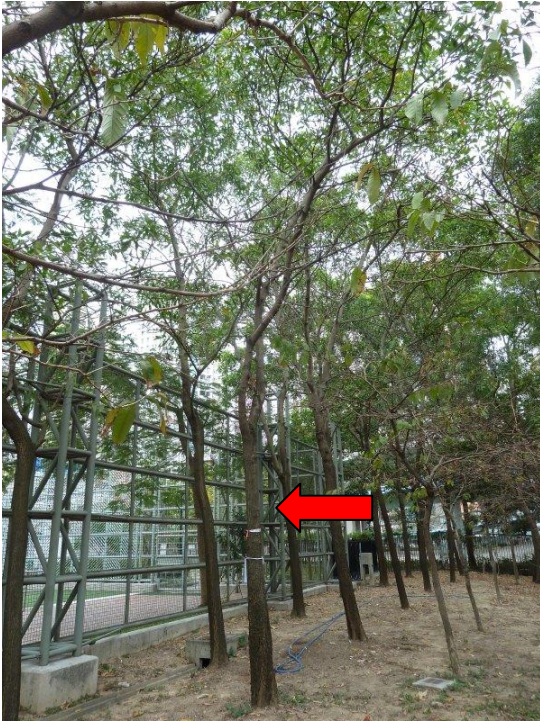
7. 櫻桃街公園南園足球場看台後花床 (大葉相思)