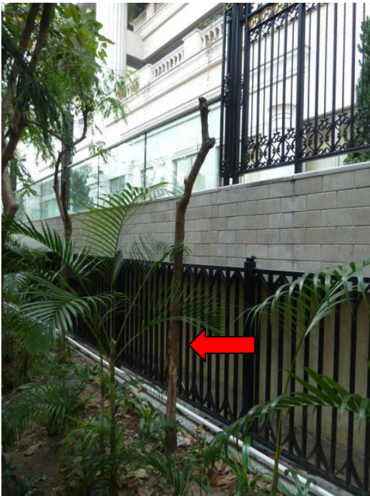
8. 櫻桃街公園北園 R25 蔭棚後面花床 (黃槐決明)