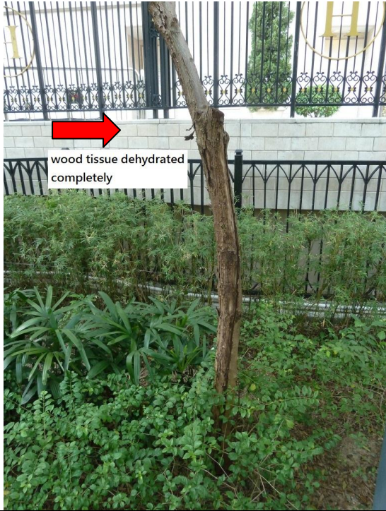
9. 櫻桃街公園北園 R30 蔭棚後面花床 (節果決明)