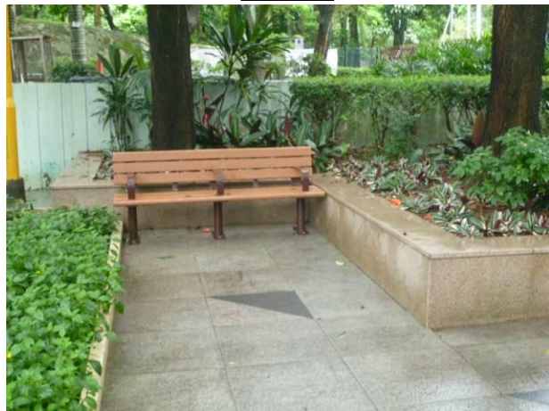
在京士柏遊樂場的籃球場旁邊空地(近紅十字會捐血站)安裝一張長椅