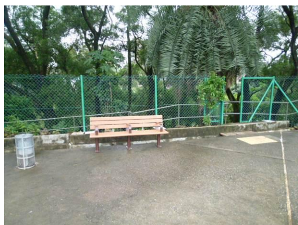
在油麻地配水庫休憩花園內安裝兩張長椅