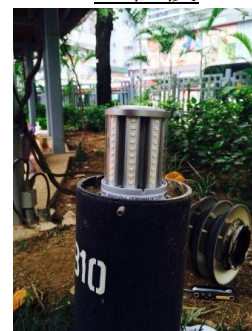
(其中 1 支圓柱燈)