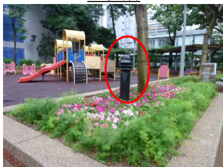
更換 10 個圓柱燈燈泡為發光二極管