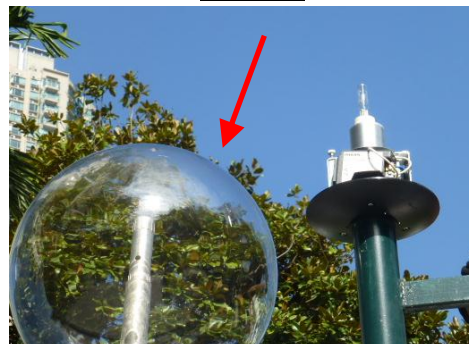
(其中 1 支公園燈)