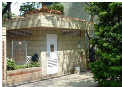
增設感光自動開關器