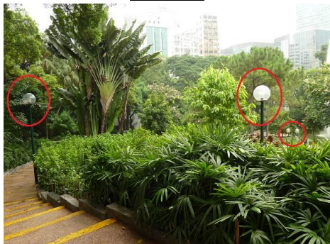
更換 312 個公園燈燈泡為節能燈泡