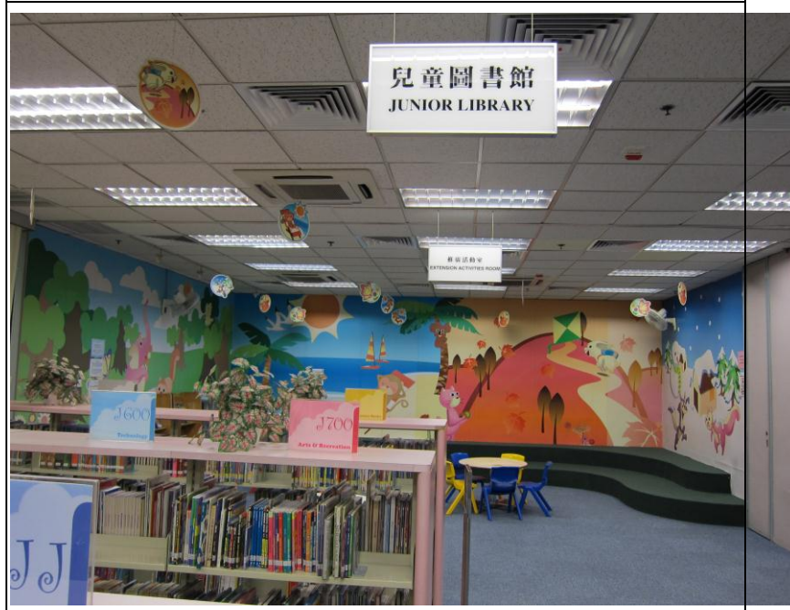
尖沙咀公共圖書館