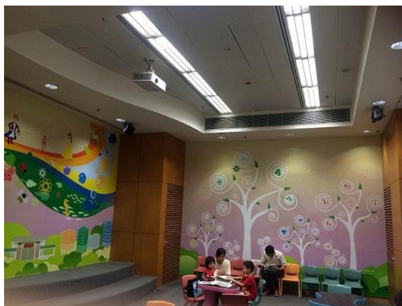
大角咀公共圖書館