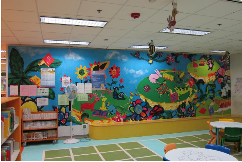
花園街公共圖書館