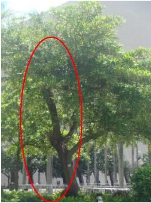
5. 香港文化中心 - 水石榕