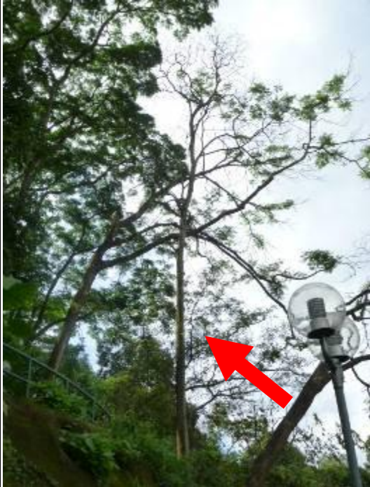
1. 京士柏休憩花園 – 石栗