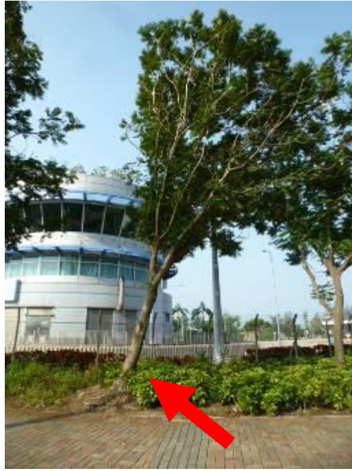
7. 柯士甸道西路邊花床 - 楯柱木 (樹幹傾斜引致表土鬆軟及樹根外露)