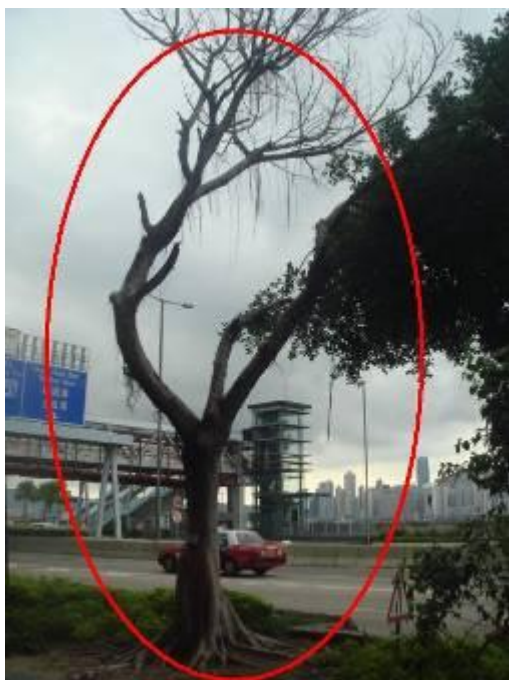
4. 梳士巴利道路邊花床 - 細葉榕