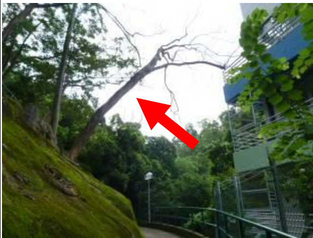
2. 京士柏休憩花園 – 鳳凰木(金鳳)