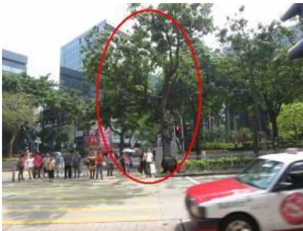
6. 漆咸道南中央分隔帶 - 石栗