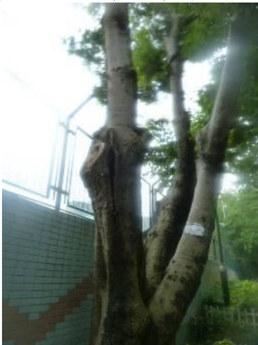
3. 佐敦道路邊花床(佐敦里) - 朴樹