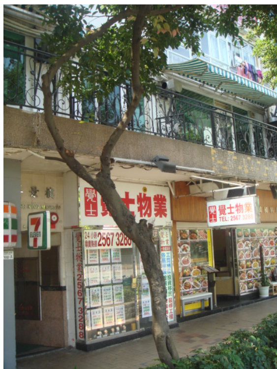
6. 柯士甸道路邊花床 - 陰香