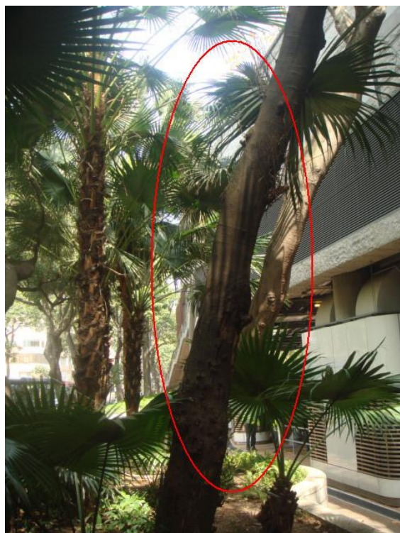
5. 漆咸道南路邊花床 - 台灣相思