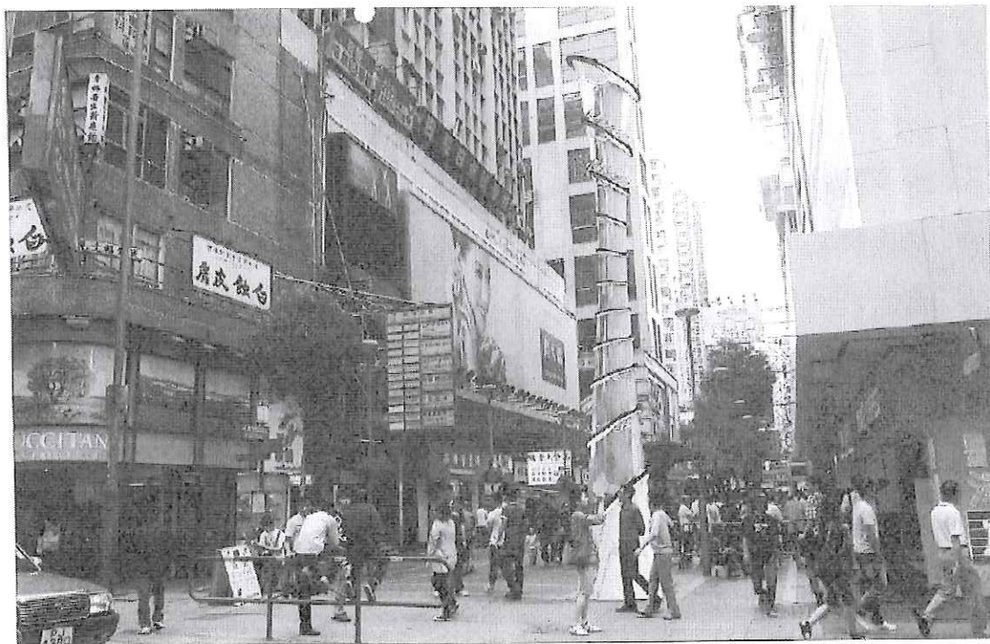
旺角通菜街(女人街)地標設計效果圖 - 方案四 [女仕指環]