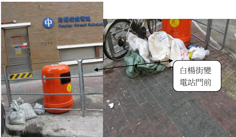
白楊街變 電站門前