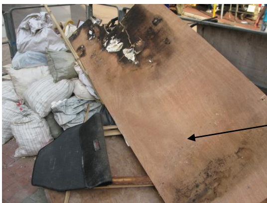
柏樹街與大 南街交界的 安全島