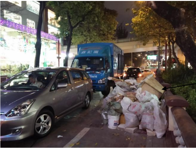
洗衣街 215 號