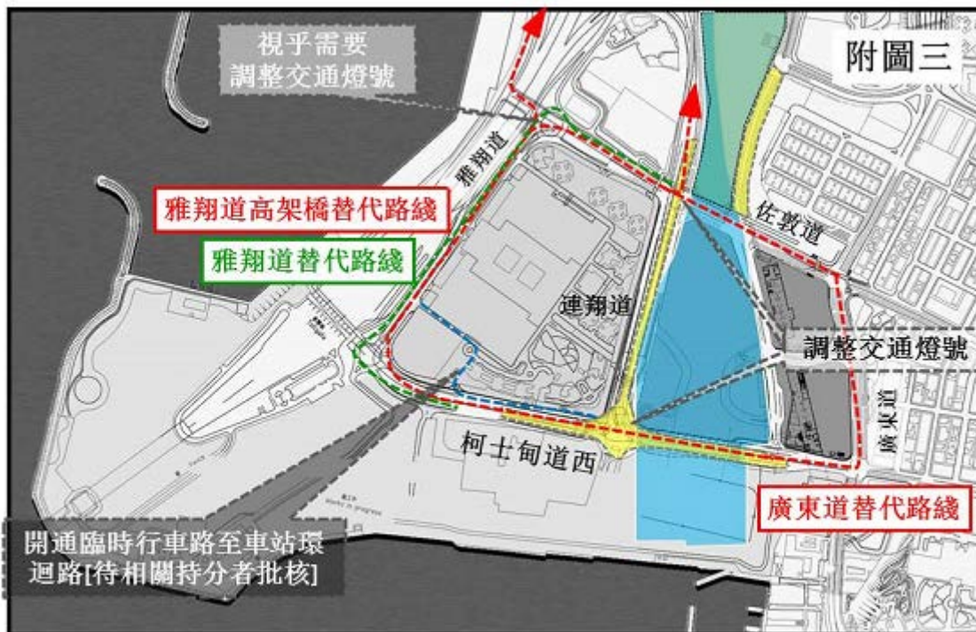
連翔道北行交通替代路線