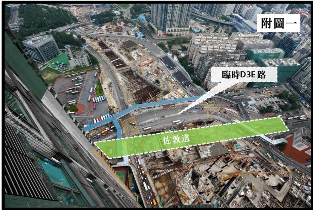
佐敦道預計於2015年7月還原