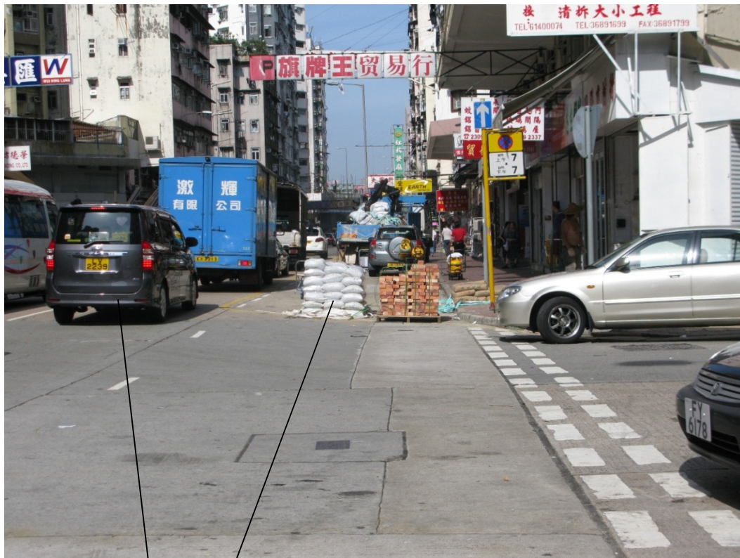
界限街 16-24 號一帶車輛違泊及貨物阻塞公共用地