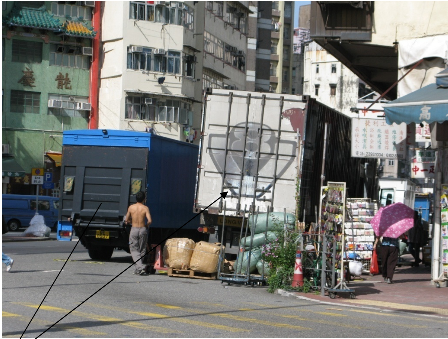
界限街 12 號(寶興大樓)側違泊上落貨物